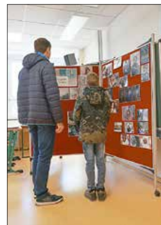
Das Kollegium der Oberschule „Klaus Riedel“

Sollte es euch/Ihnen an unserer Schule gefallen haben, dann freuen wir uns auf Ihre Anmeldungen für das Schuljahr 2023/2024. Nähere Informationen erhalten Sie dazu auf unserer Homepage www.os-bernstadt.de unter der Rubrik Aktuelles -> Neue Kl. 5.