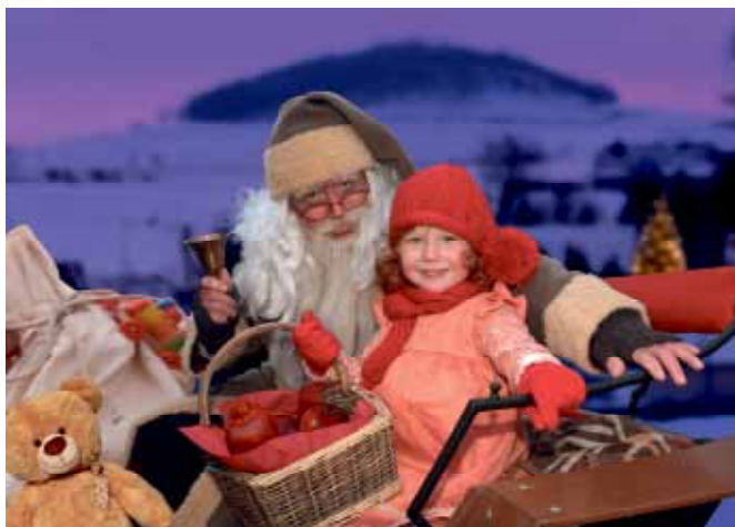
unser Dittersbacher Nikolaus und das Apfelmädchen Emilia sagen DANKE

Ganz herzlich bedanken wollen wir uns auch bei all den vielen fleißigen Helfern, ebenso bei den Vereinen und den Firmen für ihre Unterstützung, und ganz speziell bei den Dittersbacher Strickfrauen, beim Spender vom Weihnachtsbaum, bei den Organisatoren der Sonderausstellung in den Dittersbacher Heimatstuben, bei der Knüppelkuchenteig-Bäckerin – und natürlich auch bei unserem Dittersbacher Nikolaus, bei seinem Apfelmädchen und dem Fahrer.