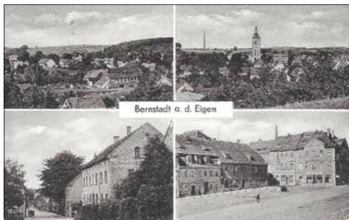
Bernstadt a. d. Eigen