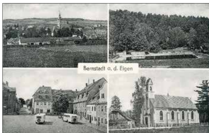
Bernstadt a. d. Eigen