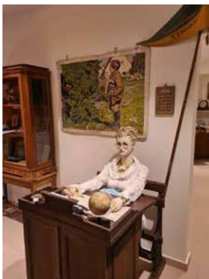
Ein Besuch lohnt sich immer !

Bitte die Hygienemaßnahmen beachten! Es gilt die 3 G Regel und Maskenpflicht.