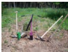
Bitte an witterungsangepasste Kleidung und festes Schuhwerk denken!

Anmeldung bis 02. April 2026 erwünscht: Telefon: +49 170 5709772 Email: uwe.steinbock@sachsenforst.sachsen.de