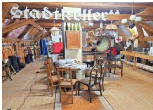
„Kneipenecke“ Museumsboden Es gibt immer etwas zu entdecken!

Sonntag, den 03.05.2026, 14.30 Uhr - 17.00 Uhr